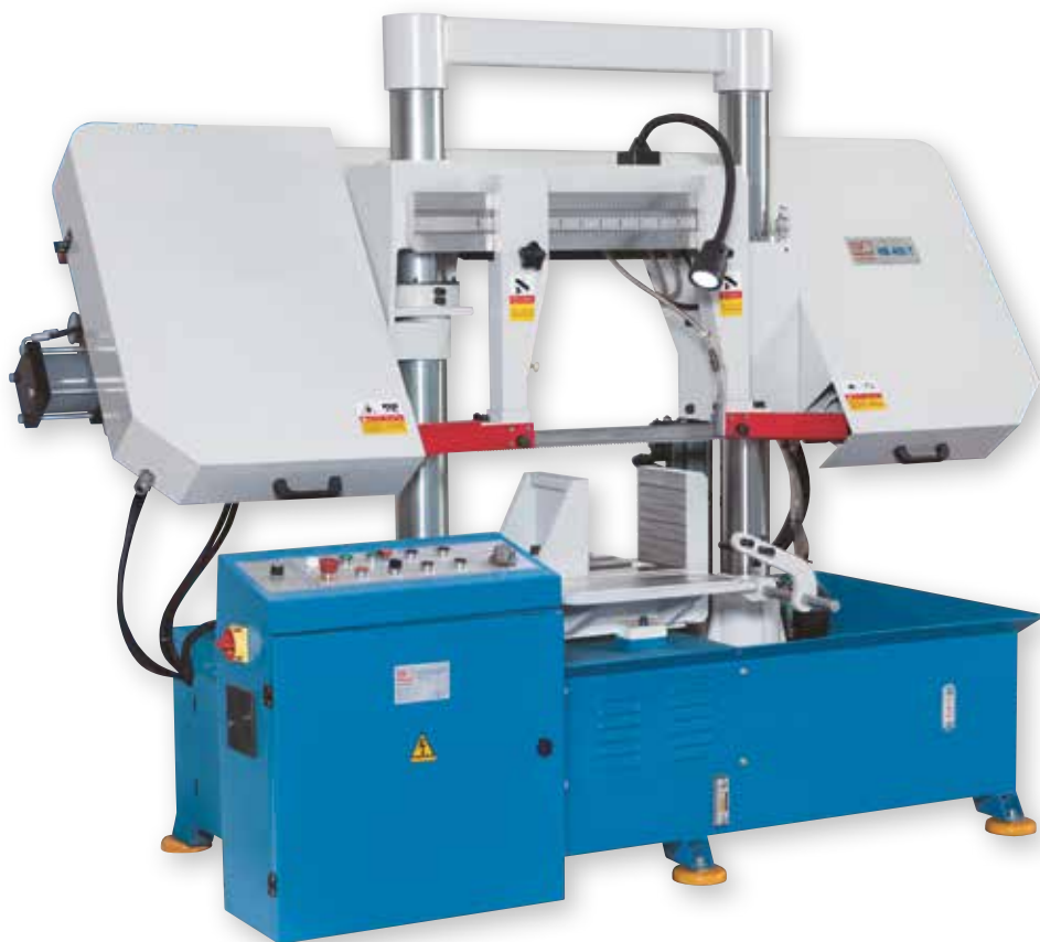
Рис. HB 400 T