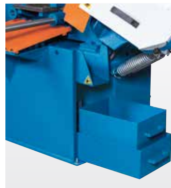
Легкодоступный бак с охлаждающей жидкостью с большим фильтром для стружки