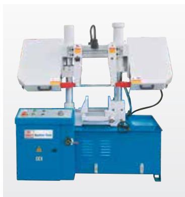
Рис. HB 280 T

Мощные промышленные ленточные пилы с гидравлическими зажимными тисками