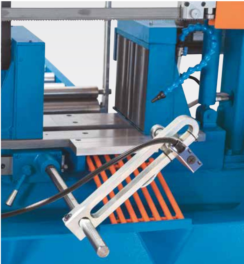
Приводные подающие ролики автоматически останавливаются при окончании материала