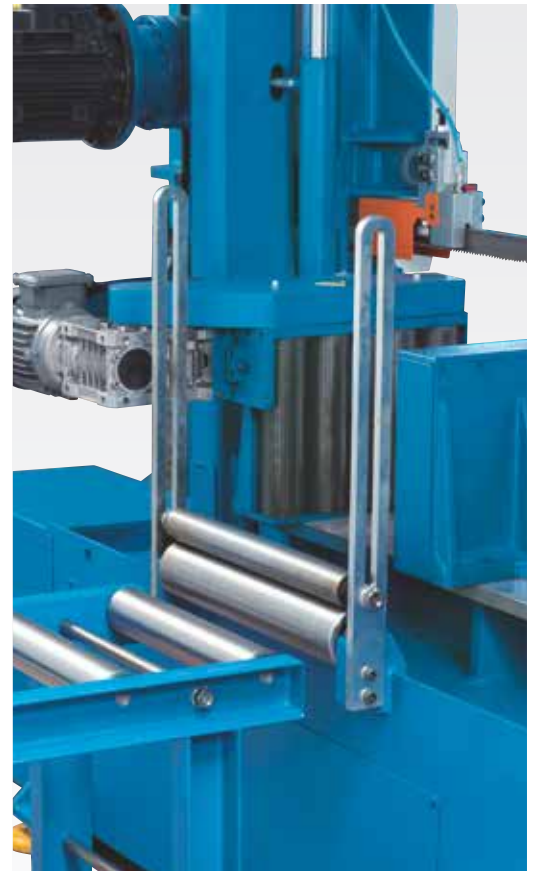
Стабильные роликовые направляющие и подача материала для набора обрабатываемых деталей