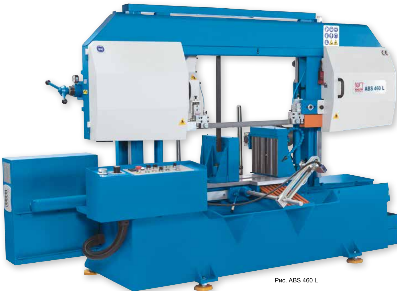
Рис. ABS 460 L