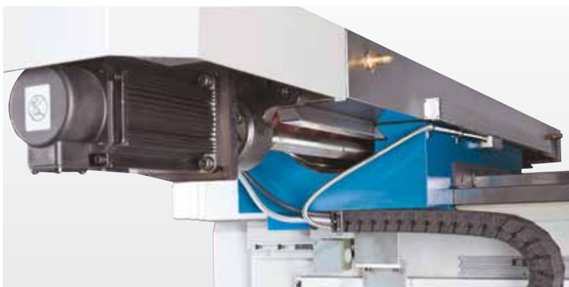
Точность, обеспеченная шариковым винтам