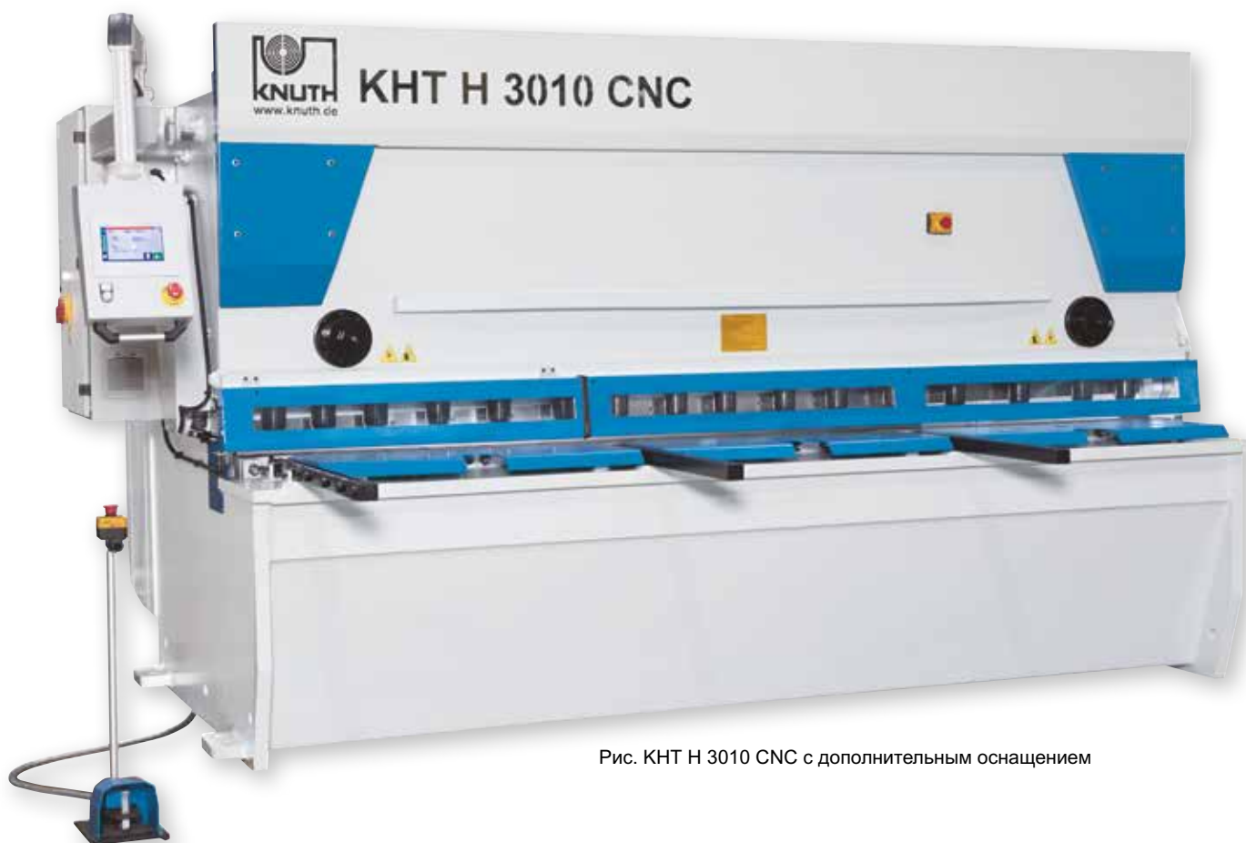
Рис. КНТ Н 3010 CNC с дополнительным оснащением

Гидравлические гильотинные ножницы с направляющими и регулированием заднего упора, ширины и угла резания с помощью ЧПУ; отличаются качеством, надежностью и простотой использования