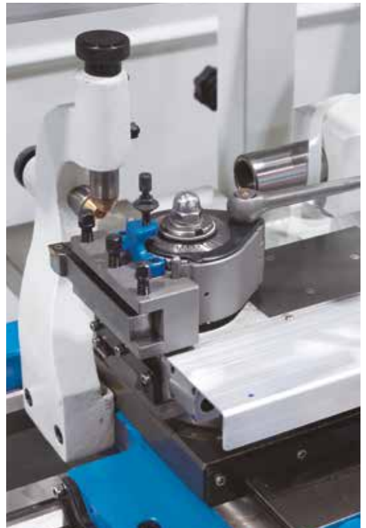
В системе быстрой смены инструмента токарные резцы всегда готовы к работе