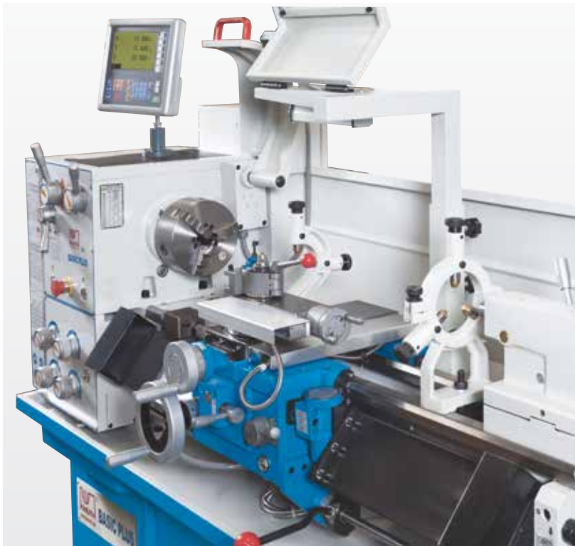
Прочный и подвижный люнет в серийном исполнении