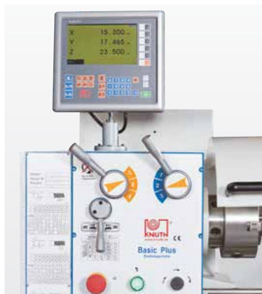
Устройство индикации координат для осей X, Z и Z1