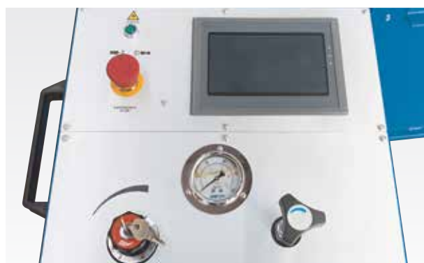
ЧПУ с графическим сенсорным экраном